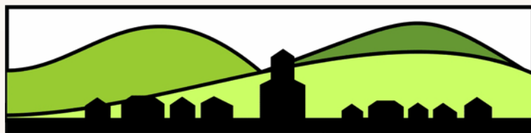
Börzsöny-Duna-Ipoly Vidékfejlesztési Egyesület