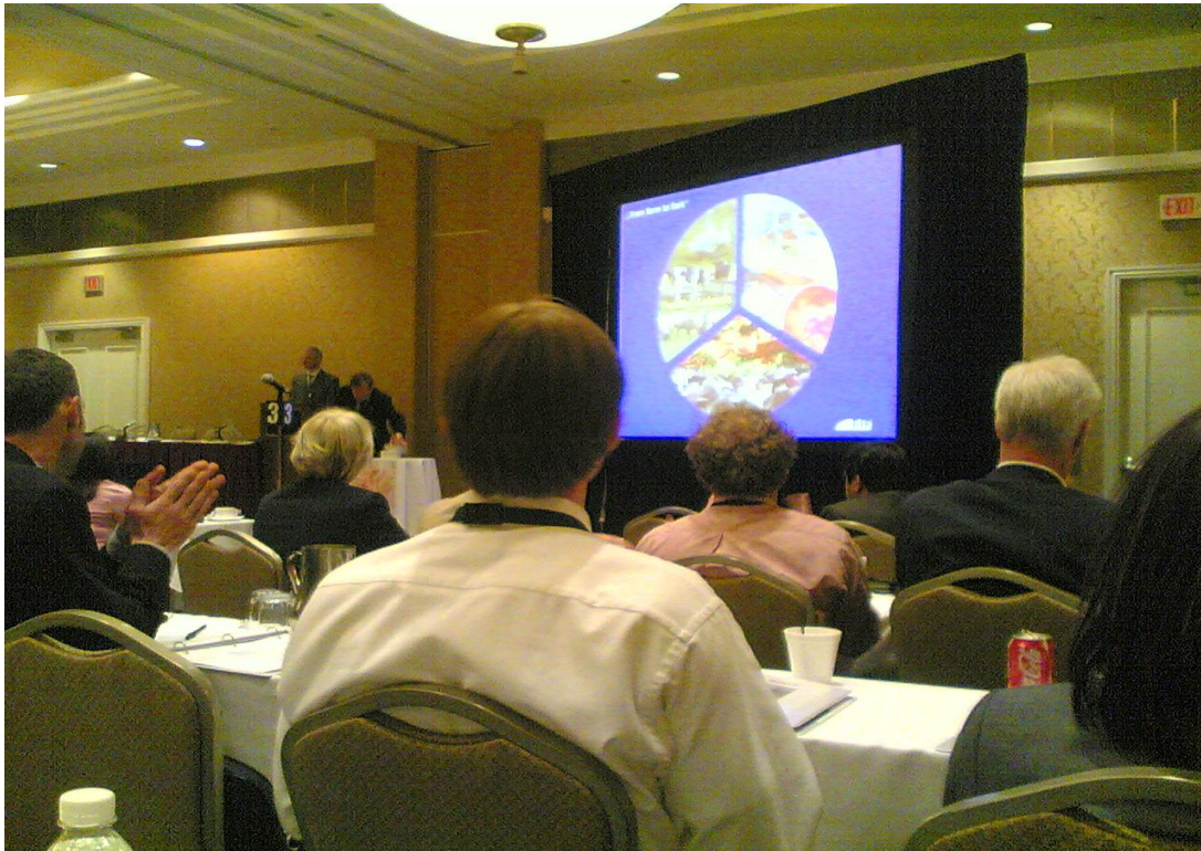
2. Kongressusi résztvevők Kanada - Niagara Falls