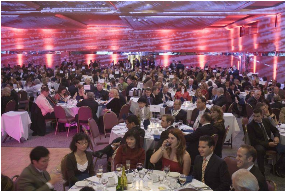
1. Kongresszusi résztvevők Hollandia

A 2010. augusztusi nagy világkonferencián, a FÉLVIT keretében, az előadások mellett kiállításokat is szervezünk, hogy azt a résztvevő szakemberek, cégvezetők és marketingesek, üzletépítésre, és az alvállalkozók, beszállítók kínálatának megismerésére, új üzleti kapcsolatok kialakítására fordíthassák.