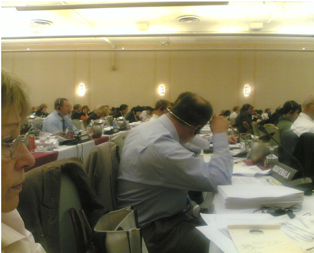
3. Kongressusi résztvevők USA